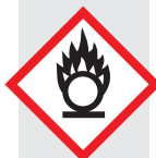
пламя над окружностью

Воспламеняющимися считаются газы, имеющие некоторый диапазон воспламеняемости с воздухом при 20 °C и 101,3 кПа. Воспламеняющиеся жидкости имеют температуру воспламенения не выше 93 °C. Твёрдые вещества, которые могут легко загореться или явиться причиной горения или поддержания горения в результате трения, также являются воспламеняющимися. Примеры: пропан, бутан, диэтиловый эфир, ацетальдегид.